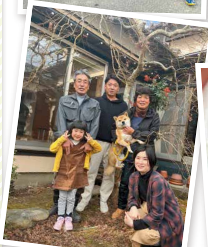
仲良し家族な弦巻家の皆さん

スーパーセンタームサシで出会い、家族に迎え入れたので「ムサシ」と名付けた。投げたおもちゃを走って取りに行き、全力で放そうとしないところがチャームポイント。