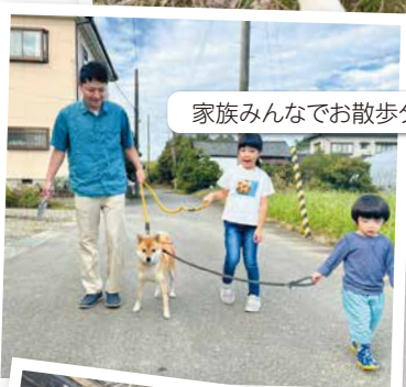
家族みんなでお散歩タイム