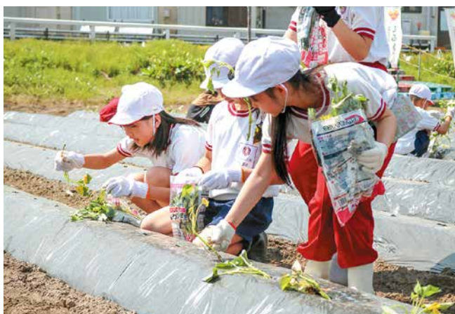
「しるきーも」の苗を定植する児童たち

新潟市立葛塚東小学校4年生107人は、農事組合法人ファーム横土居の畑でブランドサツマイモ「しるきーも」(品種「シルクスイート」)の定植を体験しました。