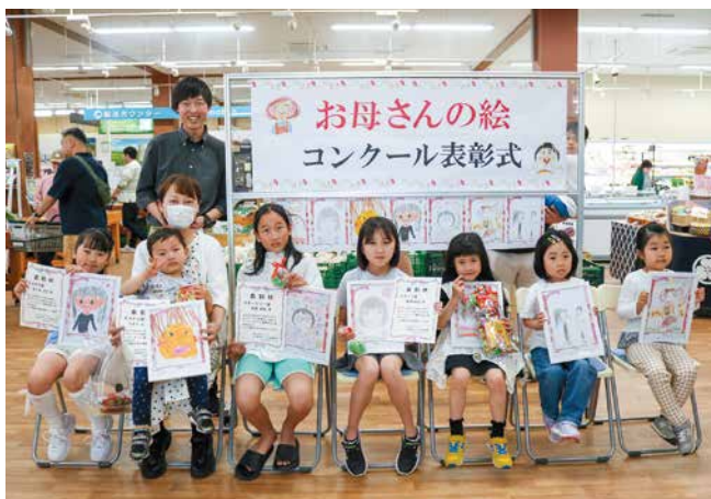
受賞した子どもたち

キラキラマーケットでお母さんの絵コンクール表彰式を開きました。直売所職員による厳正なる審査の結果、88点の応募作品の中から優秀作品7点が選ばれました。