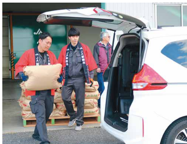
来場者の車に米を積み込む職員

5月の3日間、丸山低温倉庫にて2025年産「コシヒカリ」を1万8,000円(玄米30kg)で特別販売しました。