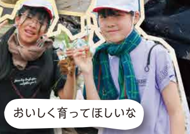
おいしく育ててほしいな