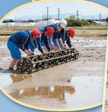
機械ってすごいなー!