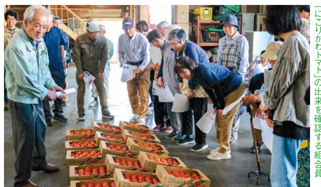
「にごりかわトマト」の出来を確認する組合員

濁川ハウス組合は「にごりかわトマト」(品種「麗宮」)の出荷目合わせ会を開き、生産者、市場関係者、JA職員ら40人が参加しました。