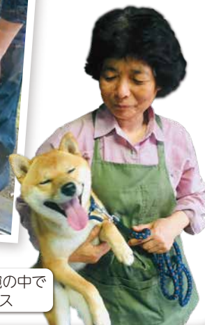
お母さんの腕の中でリラックス