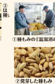
① 種もみの「温湯消毒」