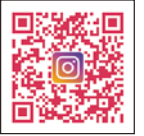
キラキラマーケット Instagram

令和8年5月14日発行 発行所:新潟市農業協同組合 編集:総務部 総務企画課 〒950-0806 新潟市東区海老ヶ瀬512番地1 TEL(025)270-2222(代表) FAX(025)270-2292