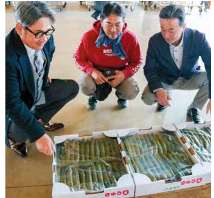
春キュウリの出来を確認する参加者

曾野木ハウス組合は、春キュウリの目合わせ会を開きました。5月中旬の出荷最盛期を前に、市場関係者やJA職員と出荷状況や価格動向などの情報を共有しました。