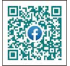
キラキラマーケット Facebook