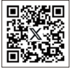
キラキラマーケット X