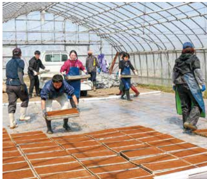
ハウスで箱並べをする職員

曾野木育苗センターで、新入職員が令和8年度水稲苗の種まき作業を体験しました。JA新潟市では毎年、新人教育の一環として新入職員が作業に参加し、春の稲作について学びます。