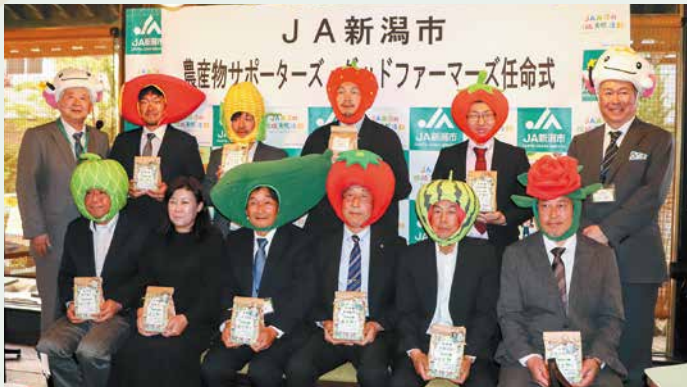
任命式に参加した「グッドファーマーズ」

4月23日(木) Nora Cucina 鏡店で「JA新潟市農産物サポーターズ・グッドファーマーズ任命式」を行い、52人が参加しました。新潟市の農業をもっと身近に、もっと元気にするために、消費者代表の「農産物サポーターズ」と生産者組織である「グッドファーマーズ」が交流し、意志を統一しました。