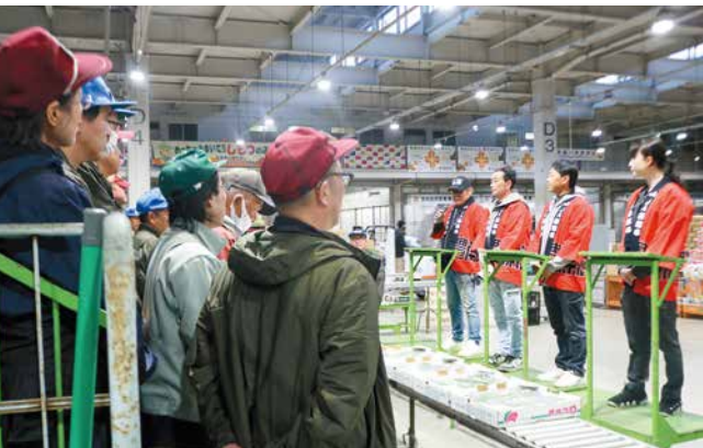
市場関係者の前で曾野木産キュウリをPRする曾野木ハウス組合の役員

曾野木ハウス組合は、新潟市中央卸売市場で曾野木産の春キュウリをPRしました。同組合では、15人が春キュウリを生産し、約160tの出荷量を見込みます。