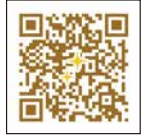
キラキラマーケット HP