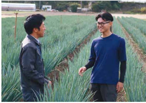
ネギの生育状況を確認する2人

J A新潟市は、ネギの名産地。秋冬に出荷される「やわ肌ネギ」は、雪のような白さと、みずみずしい甘さが魅力です。秋以降は新潟独特の冷涼な気温と、ネギの生育に適した湿度により、柔らかくて、しっとりとしたツヤのあるネギになります。