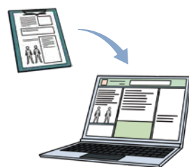
豊栄病院 医事課 宮北 寛夫

電子カルテシステムの稼働当初はスタッフも不慣れなため、ご不便をお掛けしてしまうかもしれませんが、何卒、ご理解ご協力のほどお願い申し上げます。