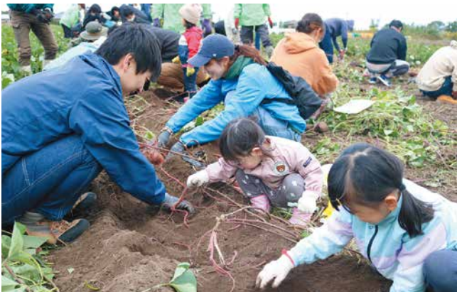
芋掘りを楽しむ参加者ら

住宅ローン利用者を対象に「さつまいも収穫祭」を開催しました。住宅ローン利用者とその家族計209人が参加。地域農業への理解や国産品の大切さを伝えることを目的とします。