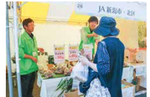
北区産の農産物を買求める来場者

訪れた方からは「おいそなメロンが目にとまった。今から食べるのが楽しみだ」という声が聞かれました。