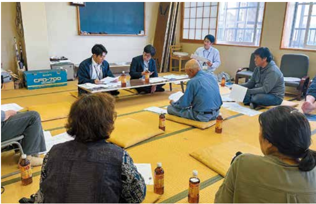
出荷に向けて話し合う参加者ら

下山蔬菜組合は、下山蔬菜集荷場で秋冬ネギ出荷会議を開きました。生産者とJA、市場関係者など10人が参加。出荷開始に向けて、管理上の注意点、各々の生育状況などを共有しました。