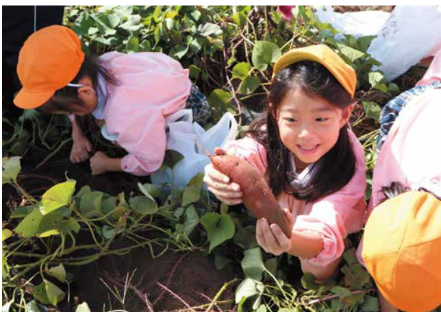
芋掘りを楽しむ園児

JA新潟市と株式会社ベジ・アビオは、北区の畑で「しるきーも」の収穫体験を開きました。藤見幼稚園年長児クラス69人と、国際こども福祉カレッジ2年生8人が実習として参加。園児たちに収穫体験を通じて「農業」や「食」に親しんでもらうことが目的で、5年前から実施しています。