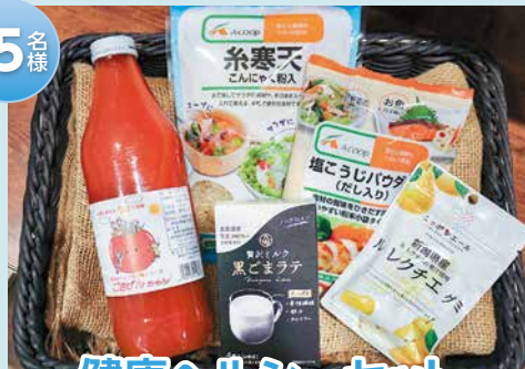
健康ヘルシーセット