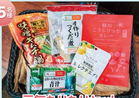
元気もりもりセット