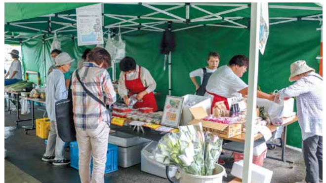
農家のお母さん方による対面販売の様子

JA新潟市は「キラキラマーケット11th農業祭」を開きました。19日には農家の女性による対面販売と「ニッポンエールグミ」の試食販売、20日には出荷農家さんによる対面販売を開催しました。