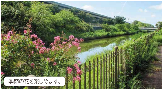
季節の花を楽しめます。