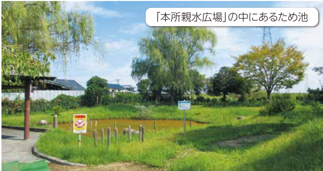
「本所親水広場」の中にあるため池