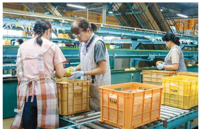
選果作業に追われるパート職員ら

両川果樹生産組合で、日本梨の共選出荷が盛んです。同組合は、生産者約60人が所属しています。8月のお盆明けから「幸水」の出荷が始まり、「二十世紀」「豊水」「南水」「あきづき」「新高」「新興」と品種をリレーしながら、12月下旬まで出荷が続きます。9月20日も広域なし選果場「梨の実館(ありのみかん)」でパート職員ら35人が、今が旬の「南水」と「あきづき」の選果・出荷作業に追われました。