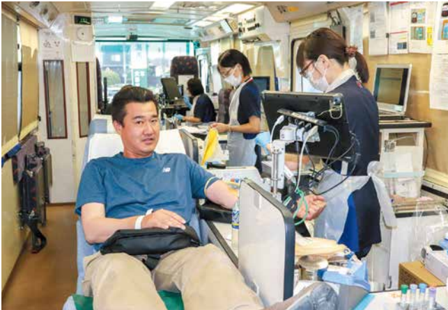
献血に参加された地域の方

JA新潟市は、県赤十字血液センターが行う献血に協力しました。今回は、地域の方々や職員など、26人が参加しました。