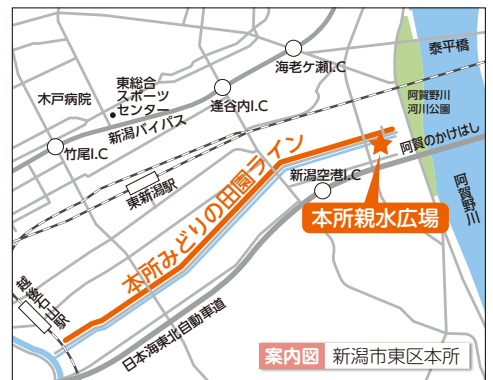
案内図 新潟市東区本所