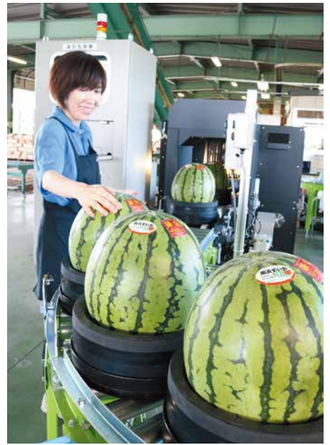
新しい機械を使った選果の様子

北部営農センター南浜選果場で、抑制スイカの品種「羅皇ザ・スウィート」の出荷が始まりました。今年は新たな選果機を導入して作業しています。