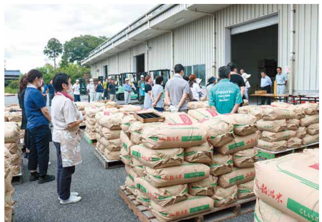
豊栄倉庫 米初検査式の様子

本店と豊栄倉庫でそれぞれ、2024年産初検査式と目合わせ会を行いました。役職員と新潟県農産物検査協会などが参加し、安全でスムーズな作業に向けて意思を統一しました。