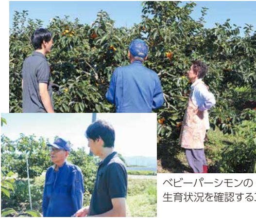
ベビーパーシモンの生育状況を確認する3人

ベビーパーシモンは、「平核無」が突然変異して生まれた品種とされています。柿は英語でパーシモンといいますが、大きさは、通常の柿の10分の1で、25〜30gほどの重さです。糖度は19〜20度と高く栄養価もあります。種がなく、皮が薄いのでそのまま食べることがができます。かわいらしい見た目と確かな食味によって、料亭からの需要も高まっています。