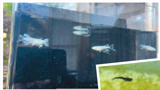
元氣よく泳ぐメダカたち