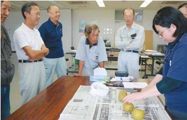
目合わせ会の様子

とよさか果樹振興組合は、日本梨「幸水」の出荷目合わせ会を行いました。生産者とJA職員、市場関係者ら8人が参加し、乾燥や病害虫、台風など今後の栽培管理上の注意点や、出荷規格などを確認しました。