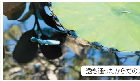
透き通ったからだのメダカ