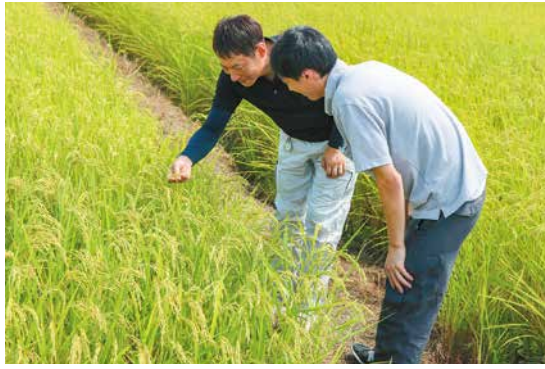
米の生育状況を確認する2人

「コシヒカリ」は、高品質と安全・安心を約束する新潟米の代表格です。独特の甘み、粘り、炊いたときの艶やかさ、香りなどが評価され、全国ブランドとして支持されています。「こしいぶき」は、「コシヒカリ」の味、艶などを受け継いだ早生品種です。しっかりとした食感を持ち、冷めてもおいしさが保たれます。