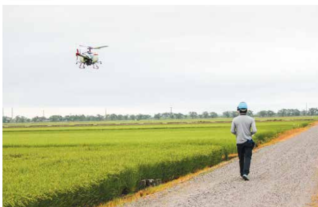
無人ヘリを操縦するオペレーター

北区の豊栄病害虫防除協議会は、8月3日から7日にかけて、管内の水田で無人ヘリコプターによる水稲の病害虫共同防除を行いました。イモチ病とカメムシ被害への対策を主な目的として、毎年実施しています。生産者と無人ヘリのオペレーター、同協議会を構成するNOSAI新潟、北区役所、防除関連会社、JA新潟市などから総勢361人が、2024年産米の品質向上を目指して、一体となって取り組みました。