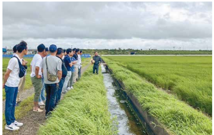
「コシヒカリ新潟大学NU1号」のほ場を見学する参加者ら

青年部は、新潟大学五十嵐キャンパスで、全体研修会を開催しました。青年部とJA職員合わせて30人が参加し、「コシヒカリ新潟大学NU1号」についての講演と、試食、ほ場の見学が行われました。