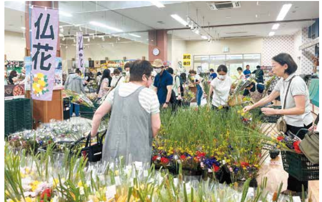
盆花を買い求める人々で賑わう店内

キラキラマーケットで「お盆フェア」を6日間開催しました。11日から13日の3日間は「お盆朝市」として通常より開始時間を2時間早め、朝8時から営業を行いました。