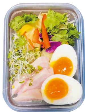
今年の勝負飯:わたしのサラダランチ

新潟シティマラソンまで残り1か月ほどになりました。体のコンディションを整え、これまで行ってきた練習の成果を発揮して皆さんと気持ちよく完走したいと思っています。