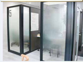
プライベートが守られる個室相談コーナー

新店舗では、よりスムーズにご利用いただくために“発券機”を導入いたしました。来店時にご利用したい項目を押していただくと“番号札”が発券されますので、お席で番号名がアナウンスされるまでおまちください!!