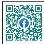
キラキラマーケットFacebook