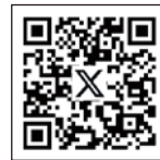
キラキラマーケットX