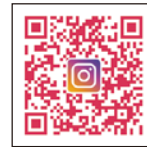
キラキラマーケットInstagram