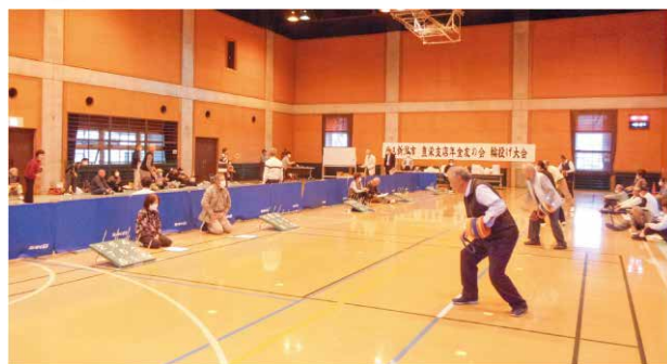
勢いよく輪を投げる会員

JA新潟市豊栄支店年金友の会は、北区の豊栄総合体育館で輪投げ大会を開催しました。会員、JA職員など10チーム、約70名が参加。会員相互の親睦と健康増進に役立てることが目的です。