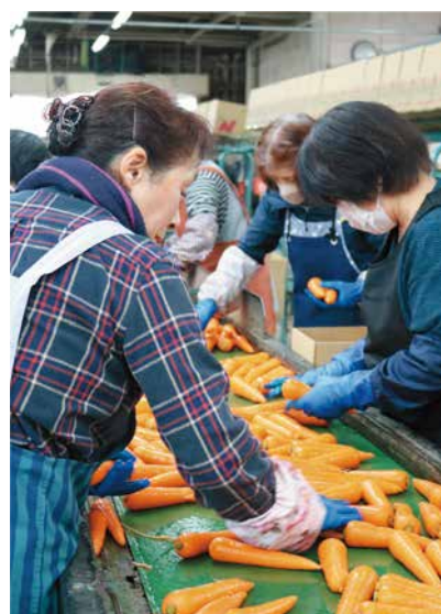
規格ごとに選別するパート職員ら

北区の木崎露地野菜生産組合にんじん部会で秋冬ニンジンの出荷がピークを迎えました。豊栄青果物センターでは、JA職員やパート職員ら約30名が出荷作業に追われています。今年産は猛暑による影響で発芽率が低く、収量は平年の7割程になる見込みですが、品質と太りは良好です。