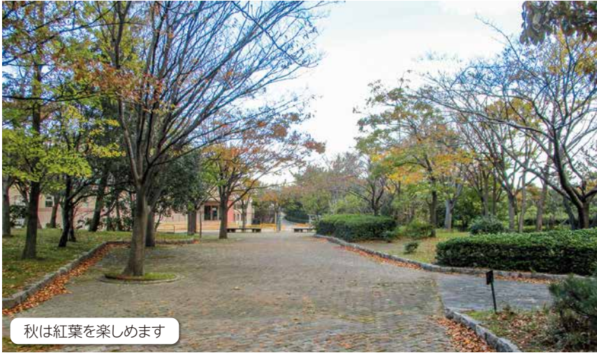
秋は紅葉を楽しめます