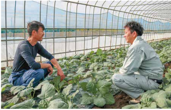
ブロッコリーの生育状況を確認する2人

ブロッコリーは、ビタミンやミネラルをバランス良く含んだ栄養豊富な緑黄色野菜です。 特に、風邪予防や疲労回復に役立つビタミンC、赤血球の形成を助ける葉酸の含量は、野菜類の中でトップクラスです。 茎の部分にも栄養があるので、捨てずに食べましょう。