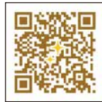
キラキラマーケットHP