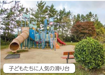
子どもたちに人気の滑り台

山の下海浜公園は新潟空港や新潟西港に隣接する場所に位置しています。そのため、飛行機や船を間近に見ることができ、迫り満点の公園として人気です。