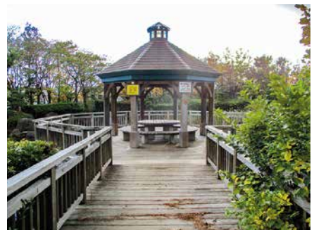
散歩コースとしても人気です