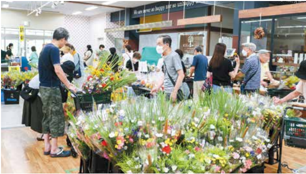
盆花を買い求める来店者でにぎわう店内

キラキラマーケットは8月11日～13日の3日間、お盆朝市を開催しました。通常より2時間早い午前8時から営業しました。