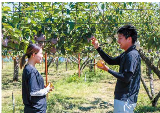
梨の生育状況を確認する2人

JA新潟市では、8月中旬〜12月中旬まで幸水、二十世紀、豊水、あきづき、新高、新興など順次出荷されています。お気に入りの梨を見つけてみてはいかがでしょうか。