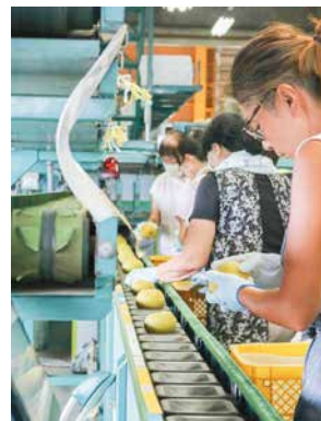
選果作業に追われるパート職員ら

江南区の両川果樹生産組合で、日本梨の共選出荷が盛んです。同区の広域なし選果場「梨の美館」では、パート職員らが選果・出荷作業に追われています。