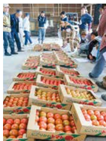
色やサイズごとに並べられたトマト