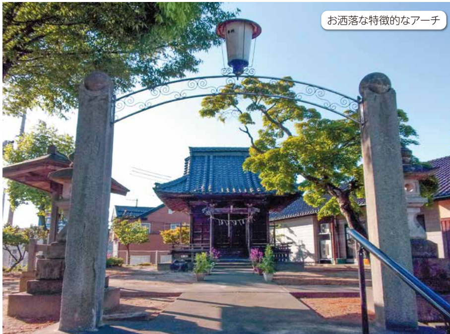
お洒落な特徴的なアーチ