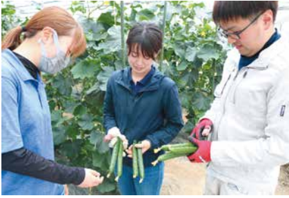
きゅうりの生育状況を確認する3人

きゅうりには利尿作用があるといわれ、むくみを除くものとして用いられてきました。冷房の効きすぎによる体調不良やだるさ、むくみのある人には最適ですが、体を冷やす働きもあるので注意しましょう。しかしこの体を冷やす働きは二日酔い等体から早く熱を取りたいときにはうってつけです。お酒の肴に加えてみるのはいかがでしょう。 JA新潟市では3月下旬から11月下旬まで曾野木・大形地区、9月中旬～11月下旬までは豊栄地区から出荷されています。