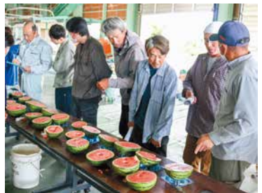
試し切りをし色味等を確認する生産者

北部営農センターで小玉スイカの目合わせ会が開かれました。生産者とJA、市場関係者らが参加し、着果日から収穫日までの日数確認や出荷規格の意思統一を図りました。目合わせ会では生産者が品種「ひとりじめ」のサンプルを持ち寄り、JA職員が糖度を測定しました。サンプルの糖度が12度以上であることを確認したうえで出荷となり、盆用のものを除いて6月中旬まで約5000箱が出荷されます。