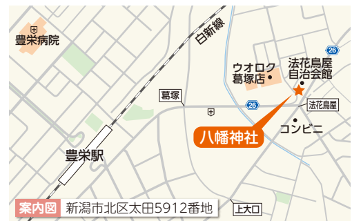
案内図 新潟市北区太田5912番地 上大口