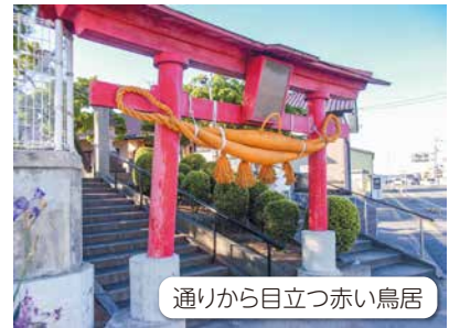
通りから目立つ赤い鳥居