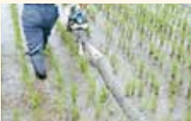
⑧ みぞ切り 中干し