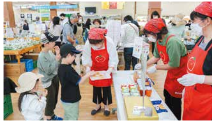
手作りジャムを振舞う女性部の皆さん(右)

女性部豊栄支部「ミニキャロル」はキラキラマーケットで開催したトマトフェアで、手作りジャムを販売しました。材料には豊栄産トマトやニンジン、梨を100%使い、栽培する際に出るB品やC品、規格外品などが活用されています。加工の活動は24年以上になります。