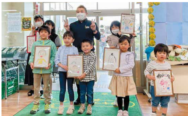
お母さんの絵を持つ子どもたち