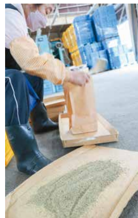
花粉を袋詰めするパート職員

豊栄青果物センターで、とよさか果樹振興組合による梨の開薬作業が5日から12日まで行われました。開薬とは、雄しべの先につけている花粉の入った粒(薬)を20時間ほど約28℃で温めて開き花粉を取り出すものです。用いる品種はおもに発芽率の良い「長十郎」や「新興」で、約700箱分の開薬が行われました。今年は前年に比べ花粉量がやや少ない傾向ですが、品質や発芽率は例年並みです。