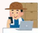
令和5年度 春季集落座談会出席状況

A 当JA個人ネットバンクは当JA及び他JAへの振込手数料は無料です。また、スマホでも取引明細の照会やローンの繰上返済及び税金等の支払いもできて大変便利です。