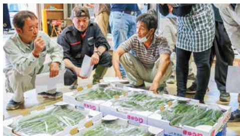
出荷規格を確認する 生産者のみなさん

曾野木ハウス組合は南部営農センターで春きゅうりの目合わせ会を開き、出荷最盛期を前に出荷規格や市場の動向を確認しました。