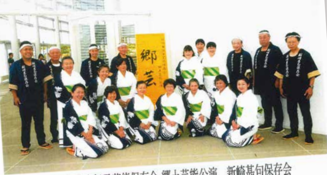
第32回 新潟市伝承芸能保存会 郷土芸能公演 新崎甚句保存会 平成30年7月15日 新潟市芸術文化会館りゅうとびあ劇場