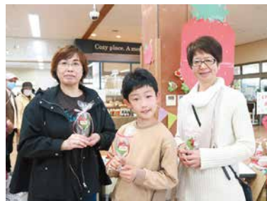
お米倶楽部受賞者のみなさま