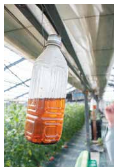
害虫予防の木酢液

す。過去にも勉強会に出て、いろいろ試行錯誤しました。でも堆肥の量が多すぎて根張りが悪かったり、やりすぎもよくないと思えましたね。失敗したら基本に戻ることが大事です。 ほとんどの作業を手作業で行っています。人手を増やしたり、便利な機械を導入したりするのは興味はありませんがハードルが高いので、現状維持で頑張っていきたいです。