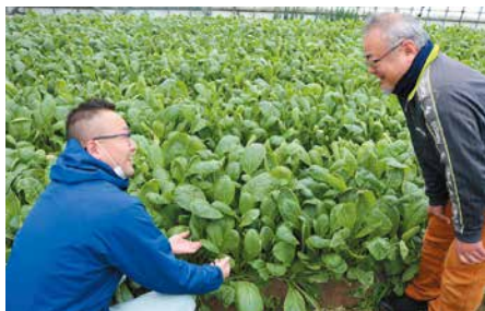
▲生育状態を確認する2人