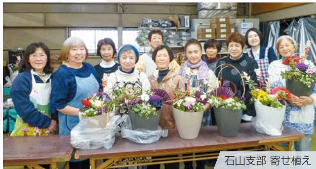
石山支部 寄せ植え