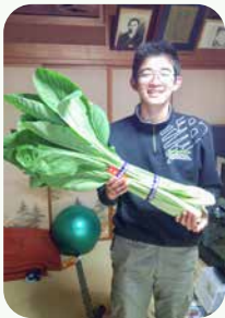
展示用に育てた“おばけ女池菜”通常の2倍以上の大きさです

今後、農家3〜4軒で小さな生産組合を作ること、機械の購入費を抑え、仕事の分担をして個々の負担を軽減し、収入を上げていくことを目指したいと考えているそうです。「後継者が減少する中で、農業には夢があるんだ」ということを若手に伝えていくことが、地域農業の将来につながるはずだ」と展望を語りました。