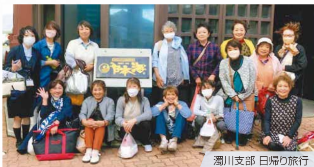
濁川支部 日帰り旅行