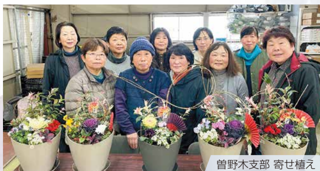
曾野木支部 寄せ植え