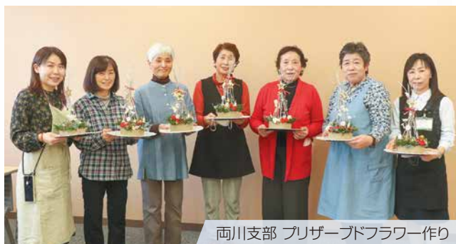
両川支部 プリザーブドフラワー作り