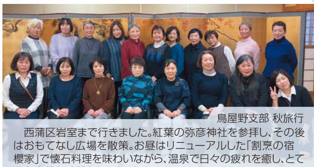
鳥屋野支部 秋旅行

西蒲区岩室まで行きました。紅葉の弥彦神社を参拝し、その後はおもてなし広場を散策。お昼はリニューアルした「割烹の宿 櫻家」で懐石料理を味わいながら、温泉で日々の疲れを癒し、とても有意義な時間となりました。