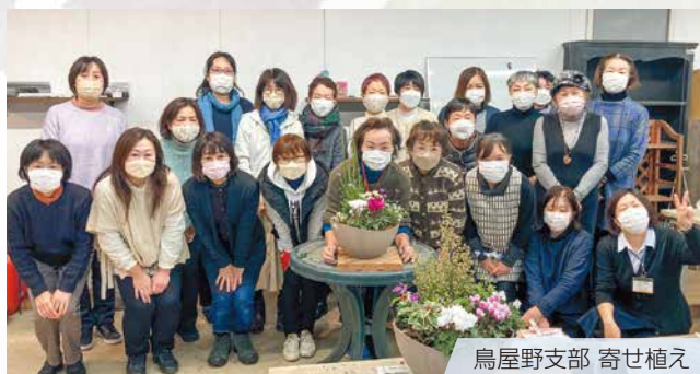
鳥屋野支部 寄せ植え

西蒲区岩室まで行きました。紅葉の弥彦神社を参拝し、その後はおもてなし広場を散策。お昼はリニューアルした「割烹の宿 櫻家」で懐石料理を味わいながら、温泉で日々の疲れを癒し、とても有意義な時間となりました。