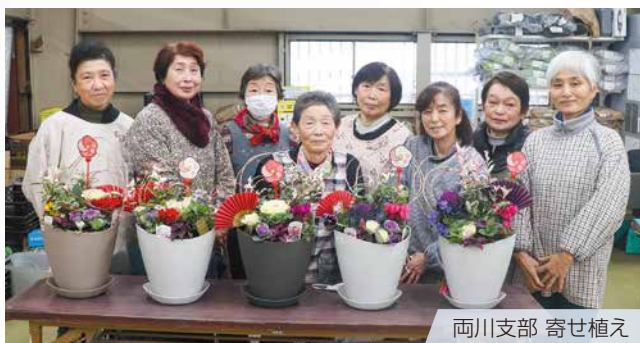
両川支部 寄せ植え