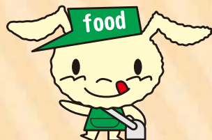
フードバンクイメージキャラクター ふーどん