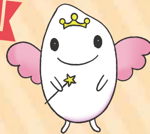
JA新潟市イメージキャラクター キラキラちゃん

JA新潟市の農産物直売所「キラキラマーケット」では、出荷者の皆さまのご協力を得ながら、フードバンクにいがたへ農産物の寄付などの支援を行っています