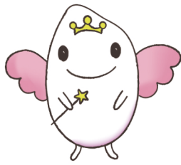
JA新潟市公式キャラクター キラキラちゃん